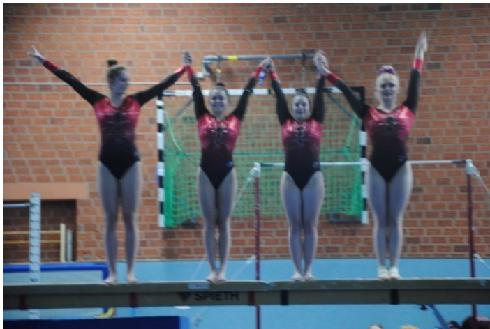
JHV Turnen 24.09.2021